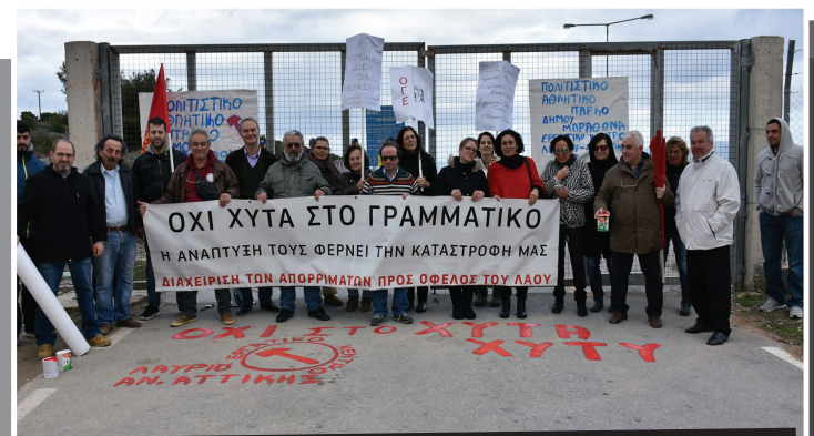
Από την περσινή κινητοποίηση στην πύλη του ΧΥΤΑ Γραμματικού

Το Ε.Κ. συμμετέχει στην Συντονιστική Επιτροπή Φορέων και Σωματείων Δήμου Μαραθώνα και πρωτοστατεί σε δράσεις και κινητοποιήσεις ενάντια στη λειτουργία του έργου. Συμμετείχε στο από κοινού, μεγάλο συλλαλητήριο, με τους φορείς της Δυτικής Αττικής, στις 6 Νοέμβρη ενάντια στις νέες χωματερές.