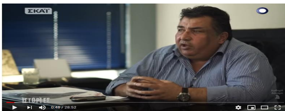
Αγία Ζώνη II: Η έλλειψη κρατικού ελέγχου, οι ευθύνες & οι πλωτές βόμβες στις ΙΣΤΟΡΙΕΣ (31/10/17)

13. Τέλλογλου προς Κουντούρη (Video 2) 00:51 λ : Κάνατε μια σύμβαση (LOF), τι είναι αυτό το (LOF) συμβόλαιο που υπογράψατε με τον κ. Σπανόπουλο;